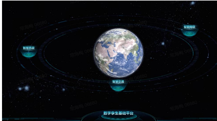
智慧南京路信息平台