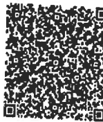
四川省注册会计师协会 已年检二维码

本证书经检验合格，继续有效一年。 This certificate is valid for another year after this renewal