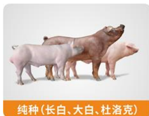
纯种(长白、大白、杜洛克)