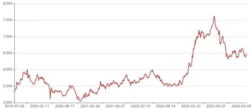
图 2. 广西白糖现货成交指数

价为 5658 元/吨，2023 年 12 月 29 日白砂糖成交价为 6438 元/吨，较年初同比增长 13.79%，全年最高成交价为 7625 元/吨，最低成交价为 5544 元/吨。