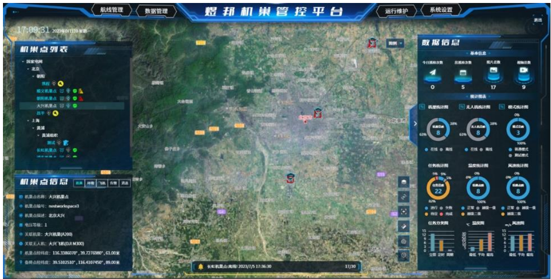
煜邦机巢管控平台

报告期内，公司完成了无人机机巢管控平台软件项目的研发、测试和部署工作，产品已形成订单。该平台实现了无人机智能巡检的集中管理，集中管理模式能够对巡检流程中的关键环节实现全过程信息化、自动化管控，提升安全性、智能化和巡检效率，进一步提升公司无人机巡检领域的技术和产品竞争力。