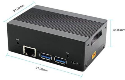
煜邦 AI 边缘计算装置