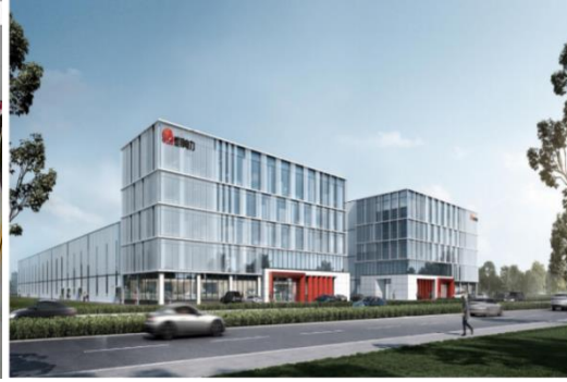
海盐县金星园区分布式储能项目厂区（效果图）