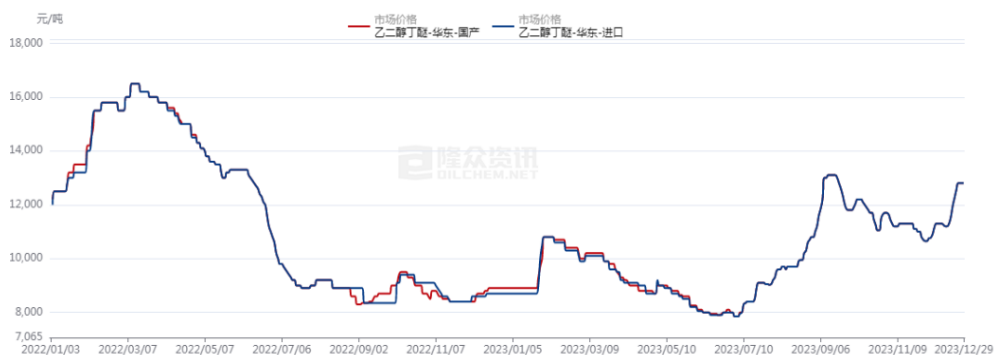
乙二醇丁醚市场价格走势图（2022. 1. 1-2023. 12. 31）