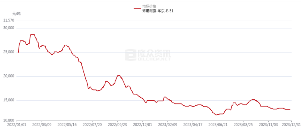
环氧树脂市场价格走势图 (2022. 1. 1-2023. 12. 31)