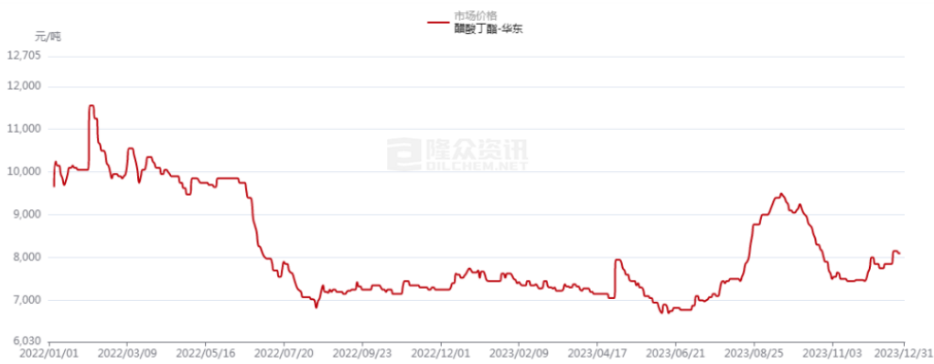
醋酸丁酯市场价格走势图（2022. 1. 1-2023. 12. 31）