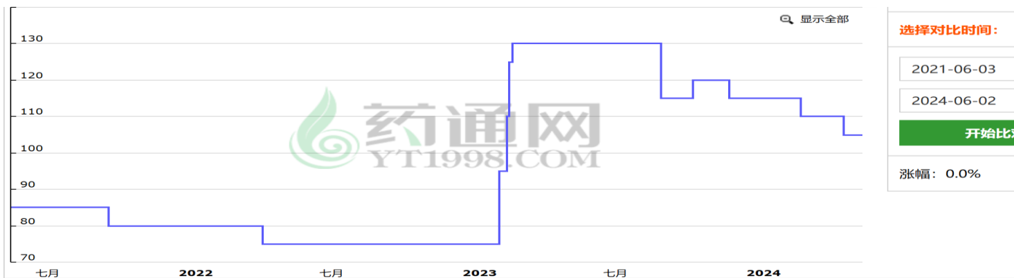
(2) 柴胡价格走势图