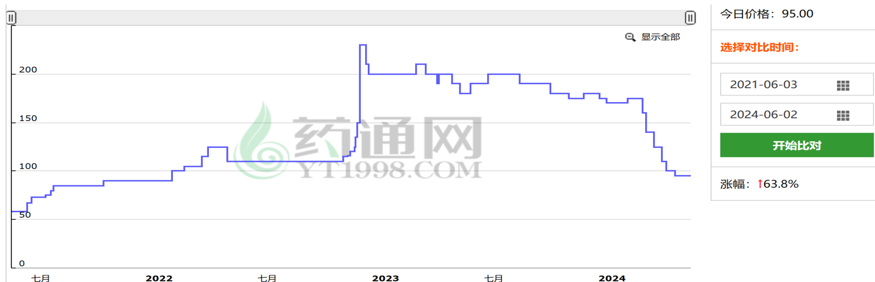
当前品种历史价格: 连翘 青生晒 山西