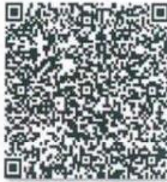
崔明的年检二维码.png

本证书经检验合格，继续有效一年。 This certificate is valid for another year after