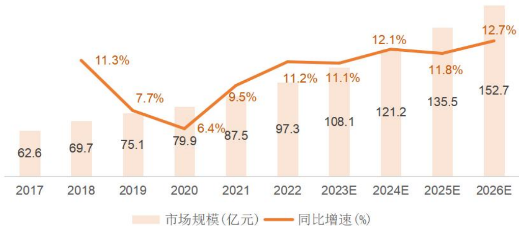
中国小型按摩器行业市场规模及预测

与大型按摩器相比，小型按摩器灵活便携，具有一定的针对性且价格便宜，适用性更为广泛，满足了广大青少年、亚健康人群和中老年群体的健康需求，2017-2022 年，我国小型按摩器行业的市场规模由 62.60 亿元增至 97.30 亿元，年均复合增长率约为 9.22 个百分点、预计 2026 年市场规模将达到 152.7 亿元，具体如下图所示：