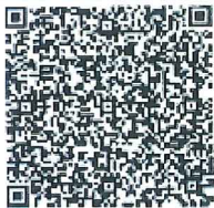
庚华英的年检二维码

本证书经检验合格，继续有效一年。 This certificate is valid for another year after this renewal.