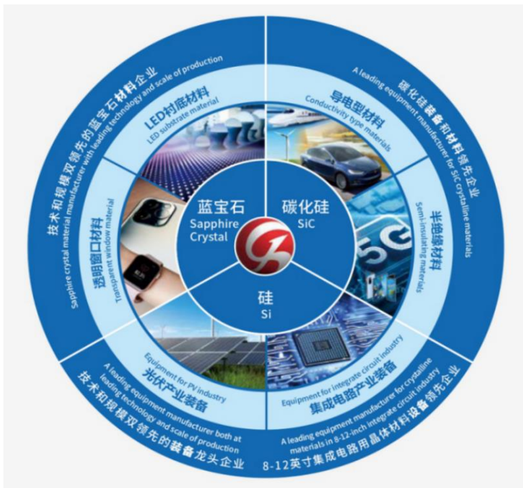
图一 公司主营业务布局