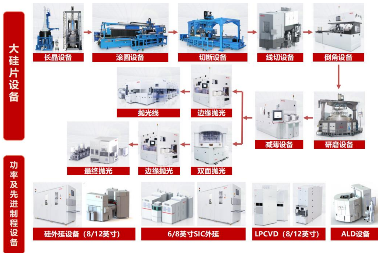
图二 公司半导体装备产品