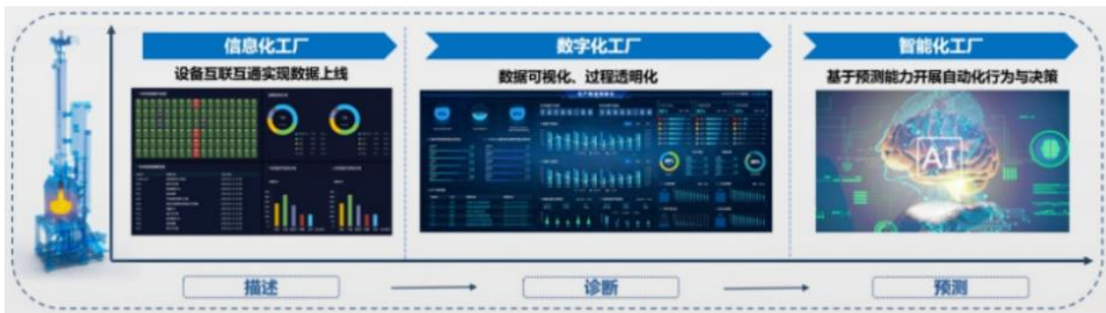
图四 公司智能解决方案

同时，以材料生产及加工装备链为主线，通过实现各装备间的数字化和智能化联通，向客户提供自动化+数字化+AI大数据的解决方案，促进客户生产效率提升；