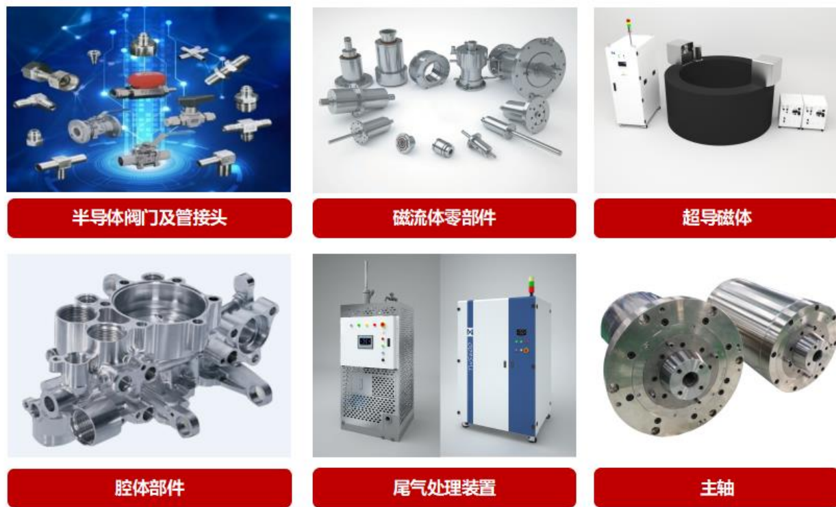
图六 公司精密零部件

公司还建立了以超导磁体、半导体阀门、管件、磁流体等精密零部件产品体系，以配套半导体和光伏设备所需关键零部件及需求，保障供应链的稳定和安全。