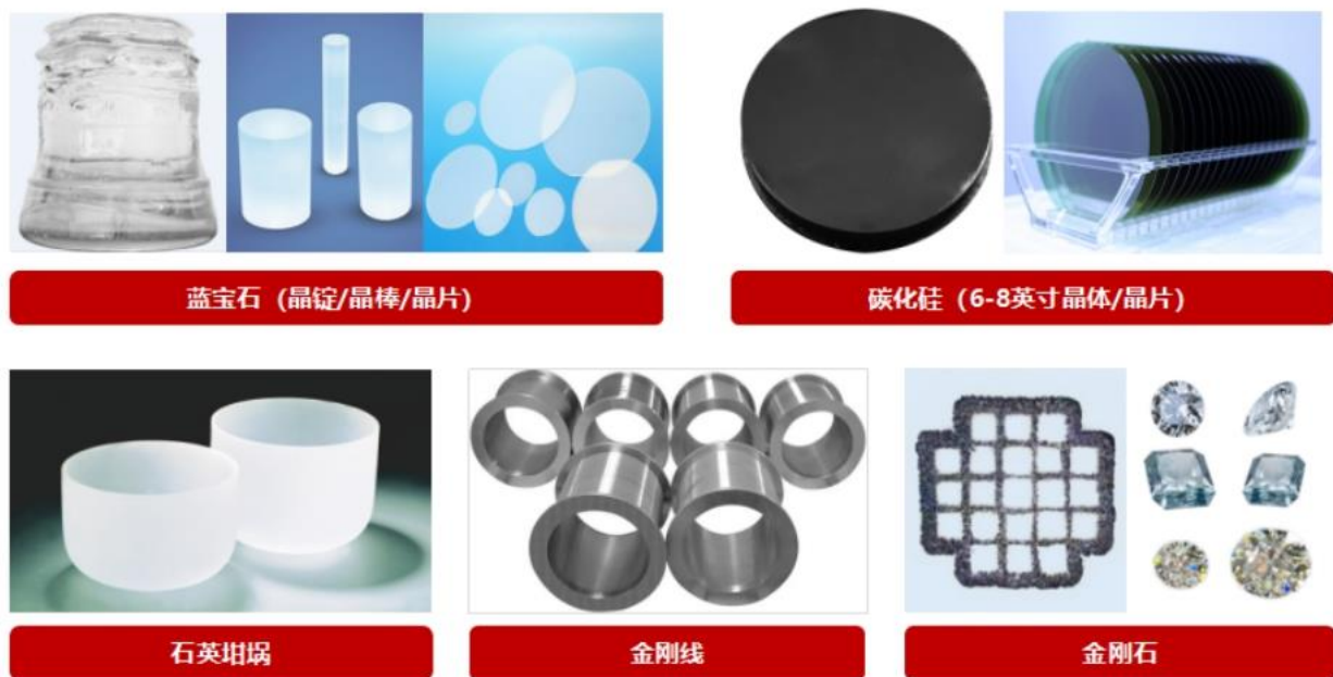
图五 公司材料业务产品