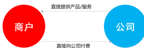
图：公司-商户的合作模式

在“公司-商户”模式下，公司产品及服务的购买对象和使用对象均为商户，该种商户一类为公司直接开发的大型商户，以大型国企事业和政府单位为主，资金实力强，倾向于直接购买支付类产品及服务；另一类为公司通过“2C”模式发展的电商客户，其通过线上商城购买公司云音箱产品等。