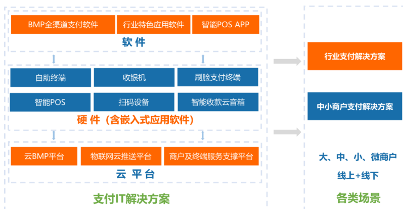
图：商户端支付解决方案

按照服务模式不同，商户规模大小，方案的个性化程度，技术实现难易程度，商户端支付解决方案分为行业支付解