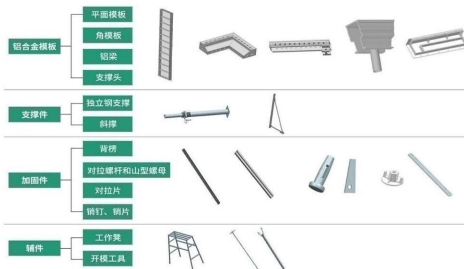
(图 1：铝模系统产品图)