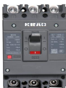
低压塑料外壳式断路器