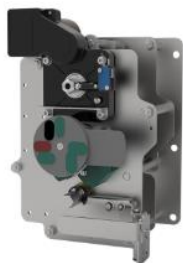
环网柜负荷开关单元操作机构