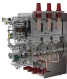
环网柜断路器单元气箱