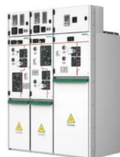
环保气体绝缘环网柜

国家能源局发布的 2024 年 1-6 月份全国电力工业统计数据中表明，截至 6 月底，全国累计发电装机容量约 30.7 亿千瓦，同比增长 14.1%。其中，太阳能发电装机容量约 7.1 亿千瓦，同比增长 51.6%；风电装机容量约 4.7 亿千瓦，同比增长 19.9%。1-6 月份，全国发电设备累计平均利用 1,666 小时，比上年同期减少 71 小时。1-6 月份，全国主要发电企业电源工程完成投资 3,441 亿元，同比增长 2.5%。电网工程完成投资 2,540 亿元，同比增长 23.7%。