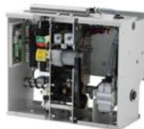
中压断路器操作机构