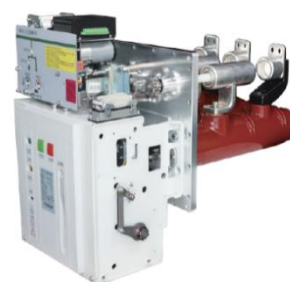
中压 C-GIS 专用真空断路器