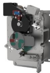
环网柜组合电器单元操作机构