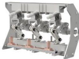
环网柜负荷开关单元开关