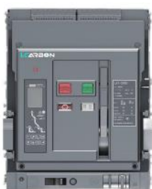
低压小型化框架式断路器