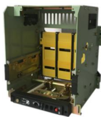
低压断路器框（抽）架