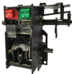
低压断路器操作机构

公司目前已发展为涵盖中低压成套配电设备其关键部附件的全产业链企业，具备从机加工、基础器件、整机设备到工艺解决方案的垂直一体化优势，既能较好地控制成本，提高产品附加值，保障产品质量，又直接面向市场，掌握市场主动权。