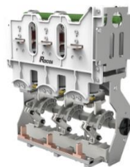
环网柜断路器单元开关