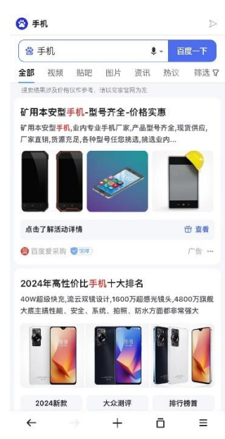
③搜索“手机”的结果示意

2、广告位业务：公司将欧朋浏览器等应用上的广告位提供给今日头条、腾讯等拥有网络广告联盟的互联网客户用于展示广告，并按照约定的计费方式（如展示时长、次数，或推广产品的激活量、点击数、销售额等）收取广告服务费。